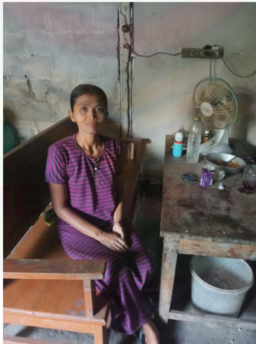
Gambar 2 Kondisi rumah KPM PKH